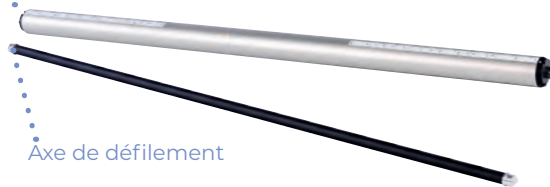
Axe de défilement

Axe gradué, conçu pour être utilisé sur chacun des emplacements de la machine, dans un sens ou l'autre.