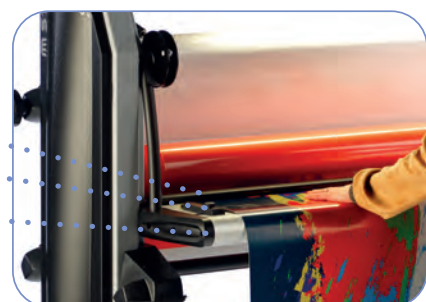
Table d'introduction épaisse avec bord arrondi qui n'abîme pas vos impressions en cours de travail.

Équerre de positionnement des panneaux rigides pour vos travaux en série