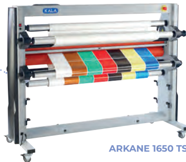
ARKANE 1650 TS

Lamination simple face ou recto verso roll to roll