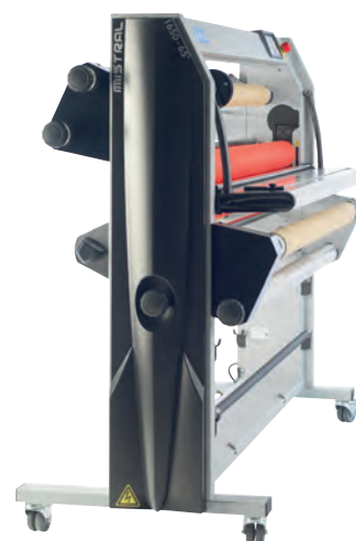
MISTRAL 1650 DOUBLE ALIMENTATION

Grâce à cette compacité, la longueur de média à utiliser pour engager le travail vers l'enrouleur n'est que de 30 cm. Tous les réglages sont à portée de main et les réglages de tension des films sont conservés en cas de remplacement des matières.